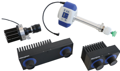
Kits Vision & Handling 3D-R